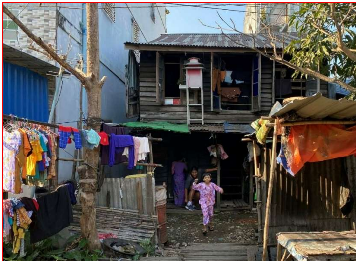
Leur unique pièce au rez-de-chaussée