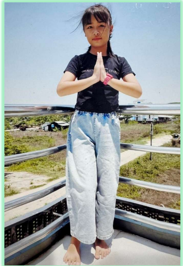
« Me voilà 2 ans plus tard , merci à vous »