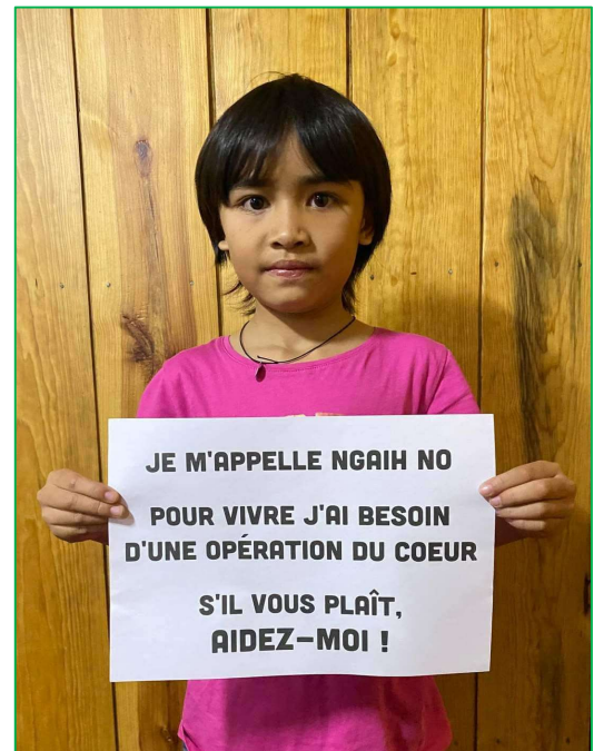
Son vœux est maintenant réalisé