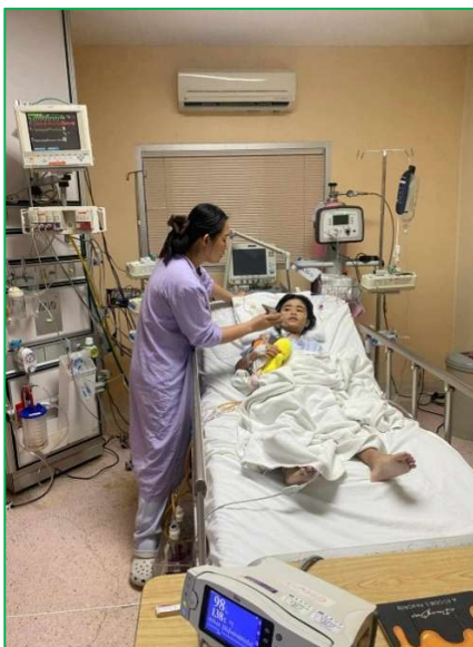
En soins intensifs